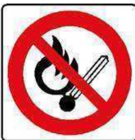
VIETATO USARE FIAMME LIBERE