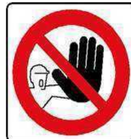
VIETATO L'ACCESSO AI NON AUTORIZZATI