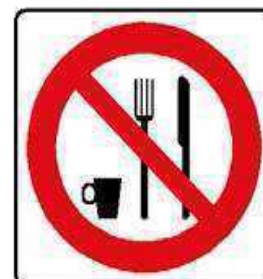
VIETATO MANGIARE E BERE

La responsabilità di questo Magazzino è del Sig. _____ a cui son affidate le chiavi per l'apertura e la chiusura